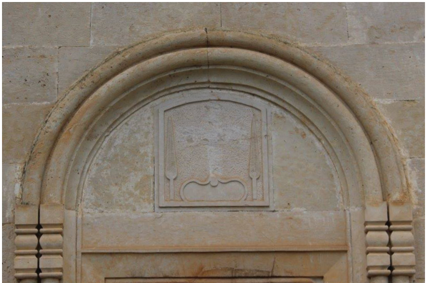
ჯვარი სამხრეთის შესასვლელის ტიმპანში.