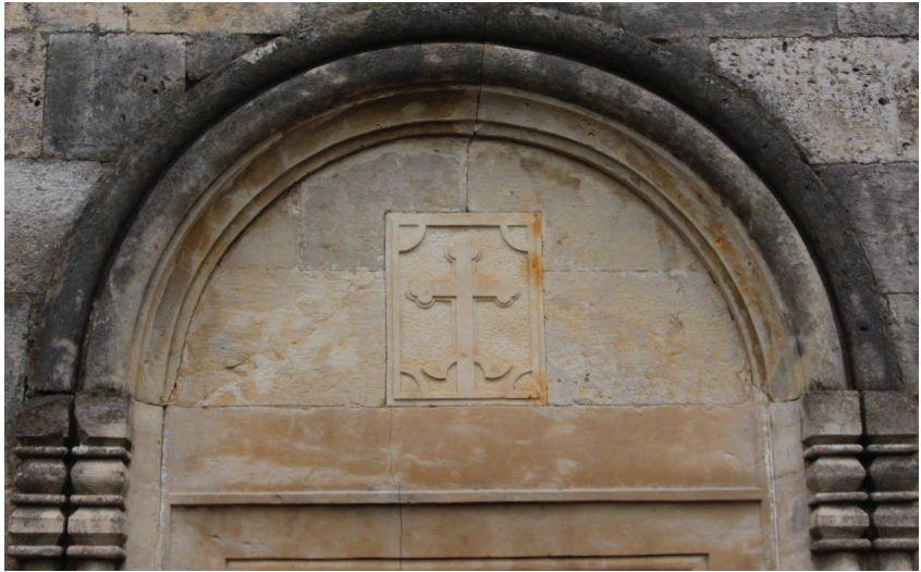
ჯვარი დასავლეთის შესასვლელის ტიმპანში.