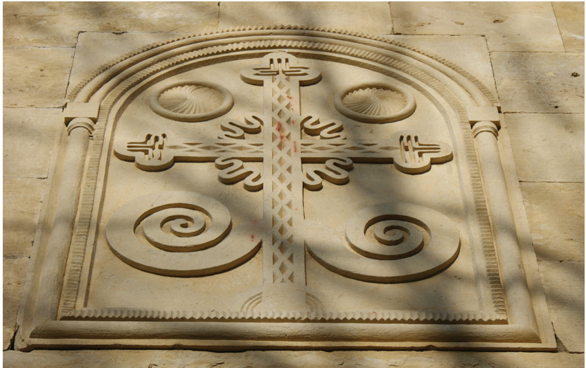
ჯვარი სამხრეთ კედელზე.