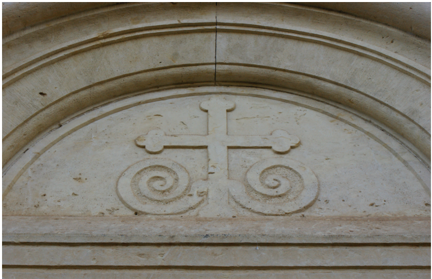
ჯვარი ჩრდილოეთის შესასვლელის ტიმპანში.