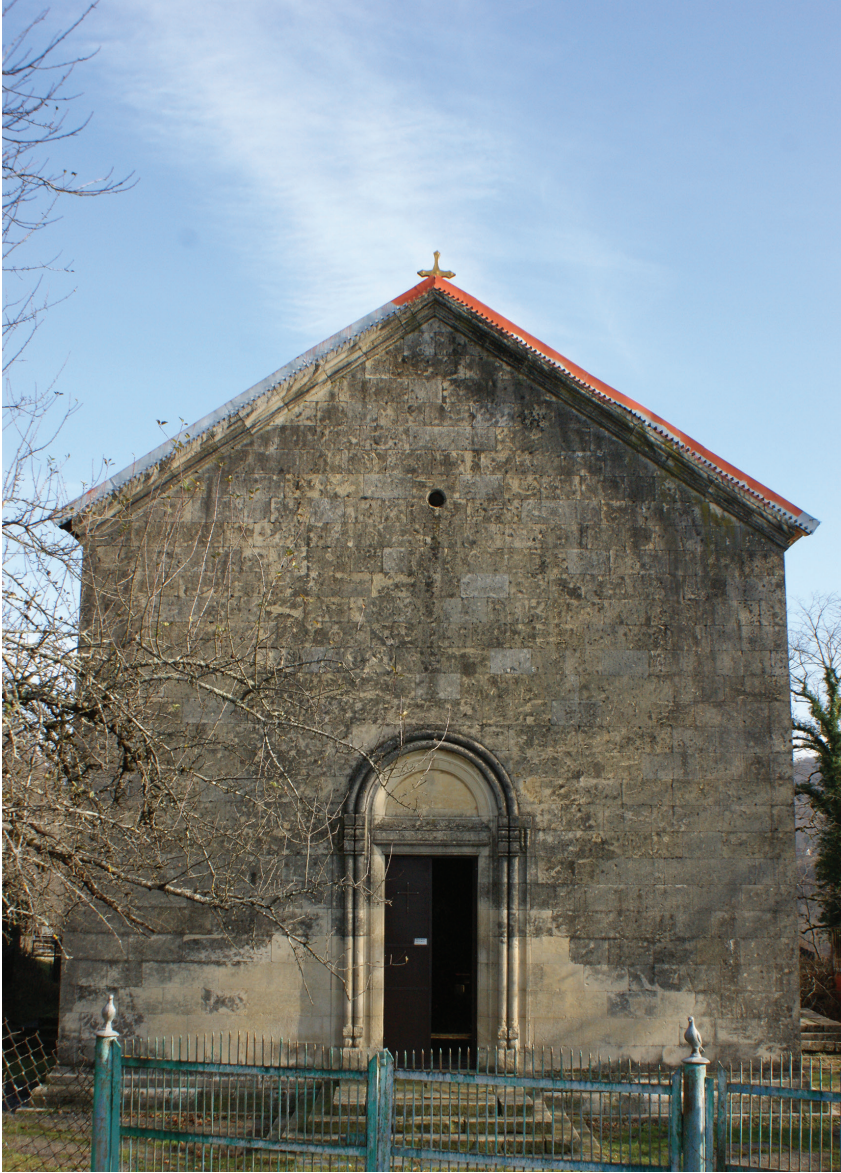
ქვედა ჭყევის წმინდა გიორგის ეკლესია. ხედი დასავლეთიდან.