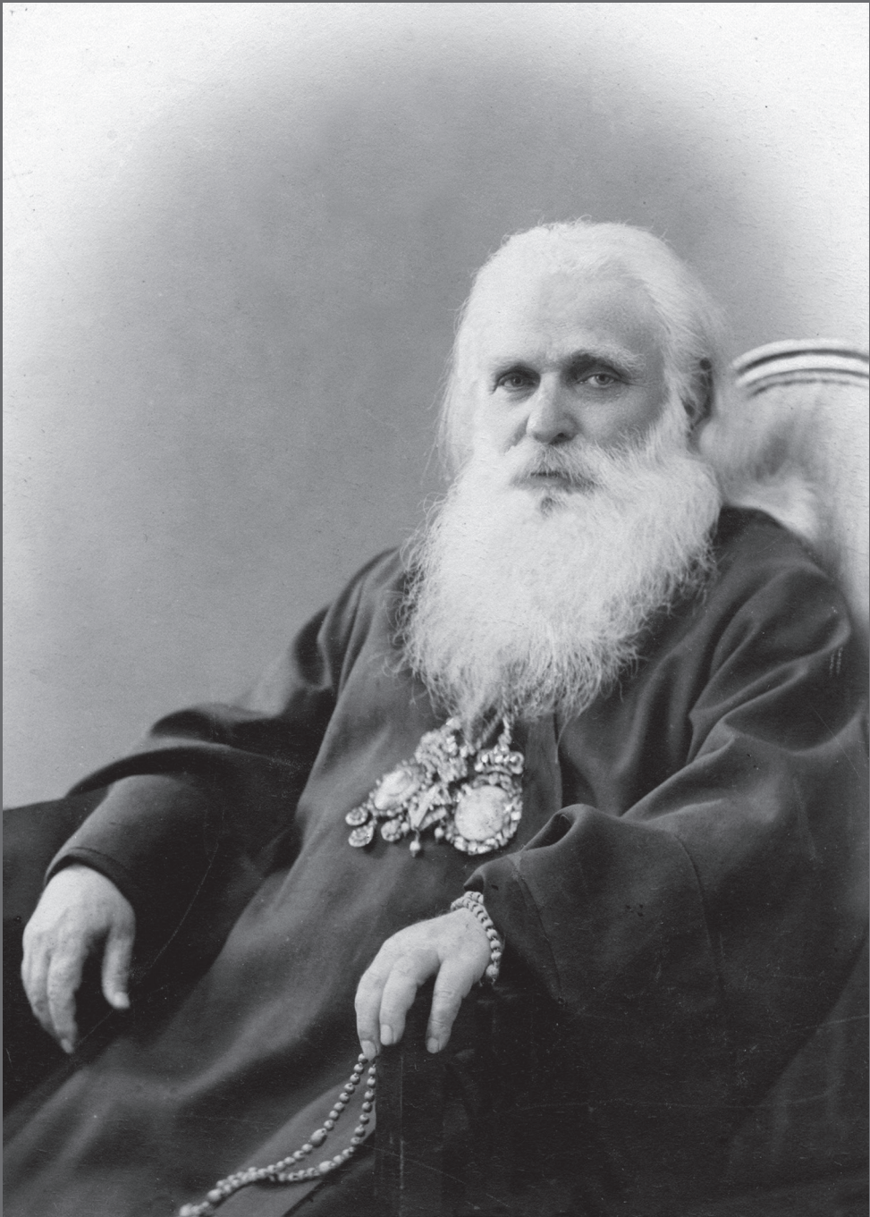
სრულიად საქართველოს კათოლიკოს-პატრიარქი ამბროსი (ხელაია)